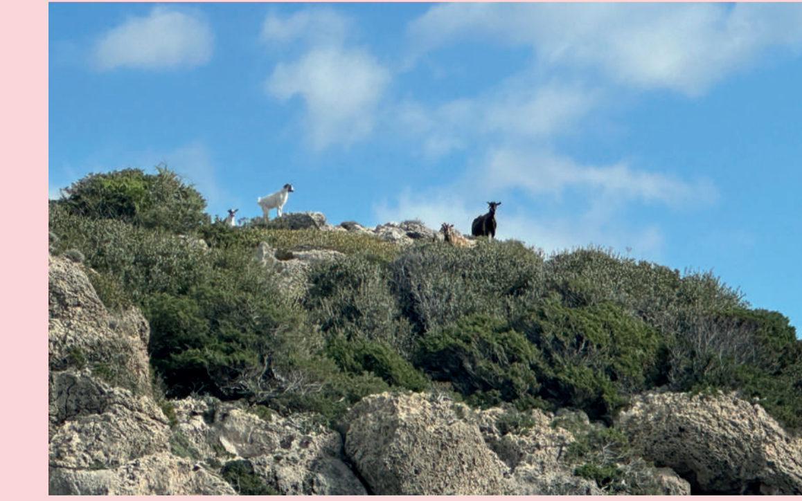
7 Sobrepastoreo Overgrazing