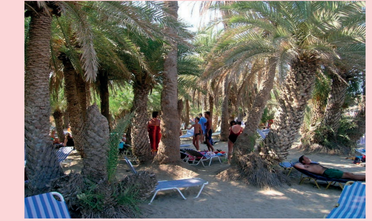
8 Presión de visitantes Visitor pressure