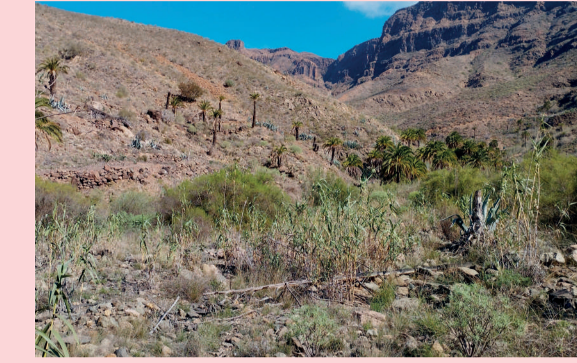
3 Escasez de agua y sequías Water scarcity and droughts