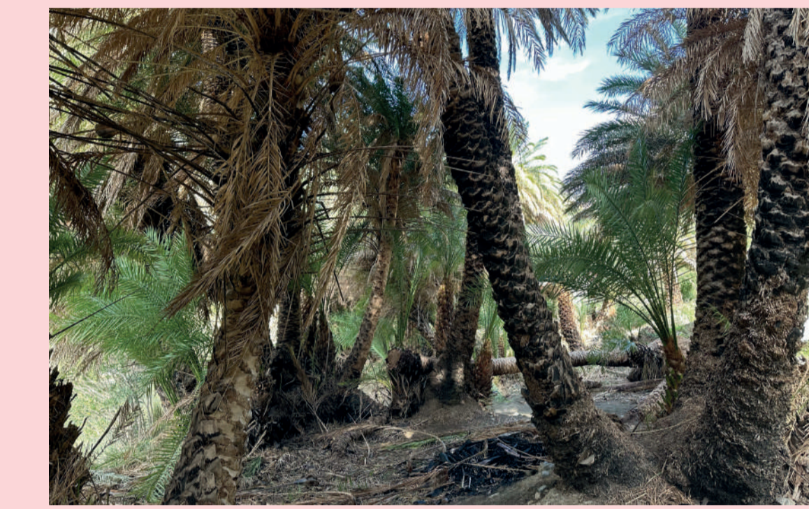
1 Degradación del hábitat Habitat degradation