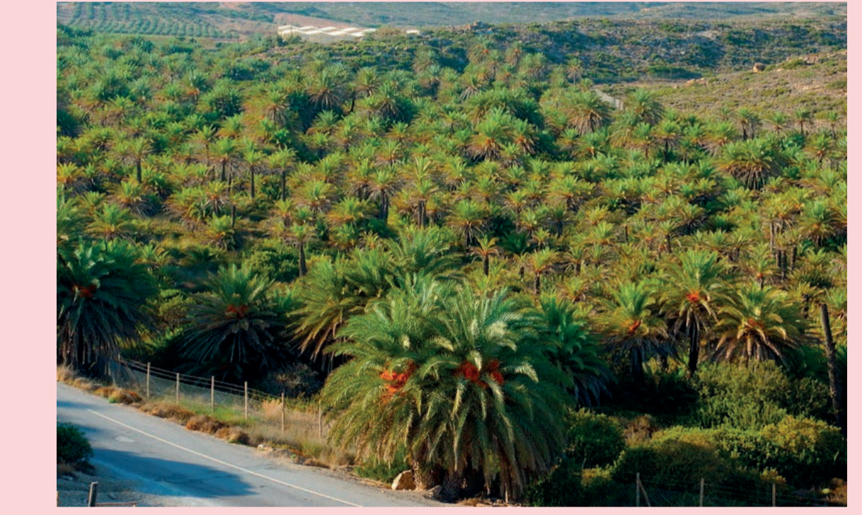
4 Riesgo de hibridación Hybridization risk