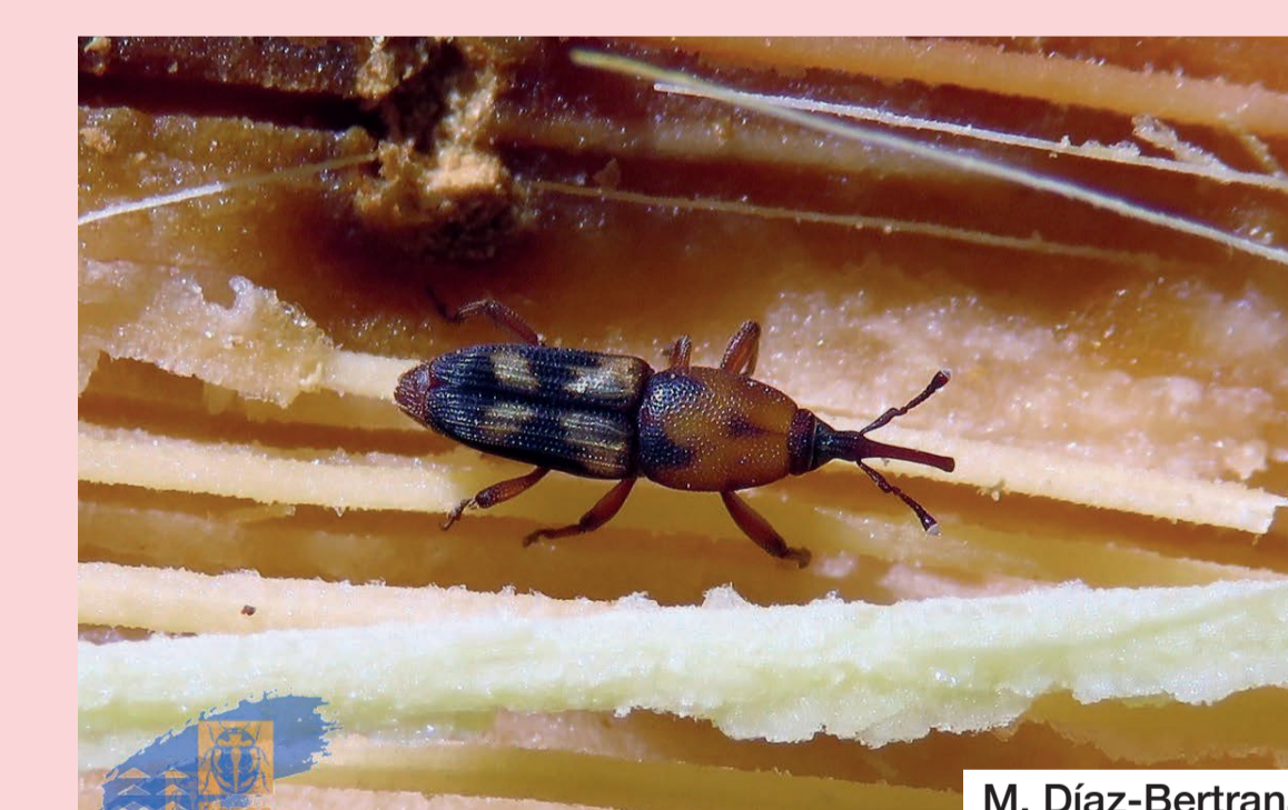
5 Plagas y enfermedades Pests and diseases