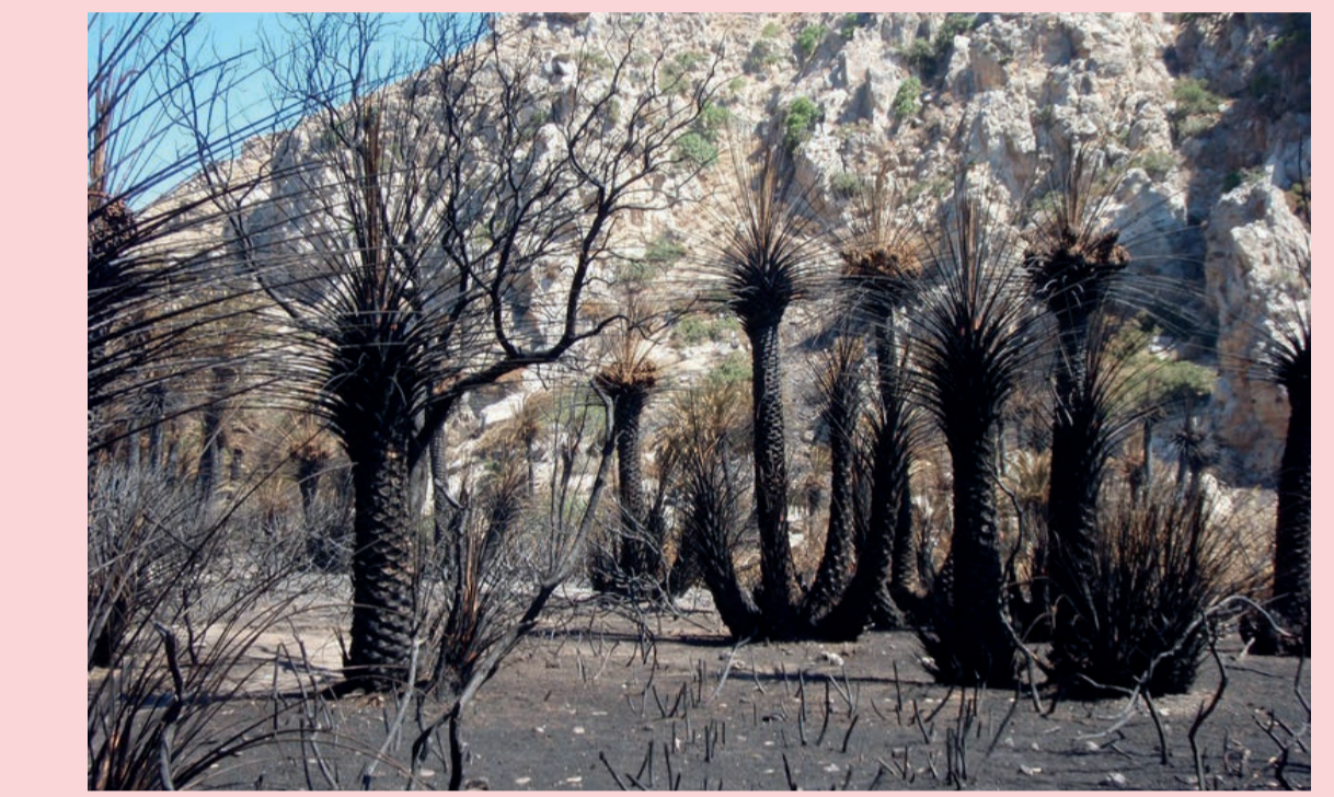
2 Riesgo de incendios Fire risk