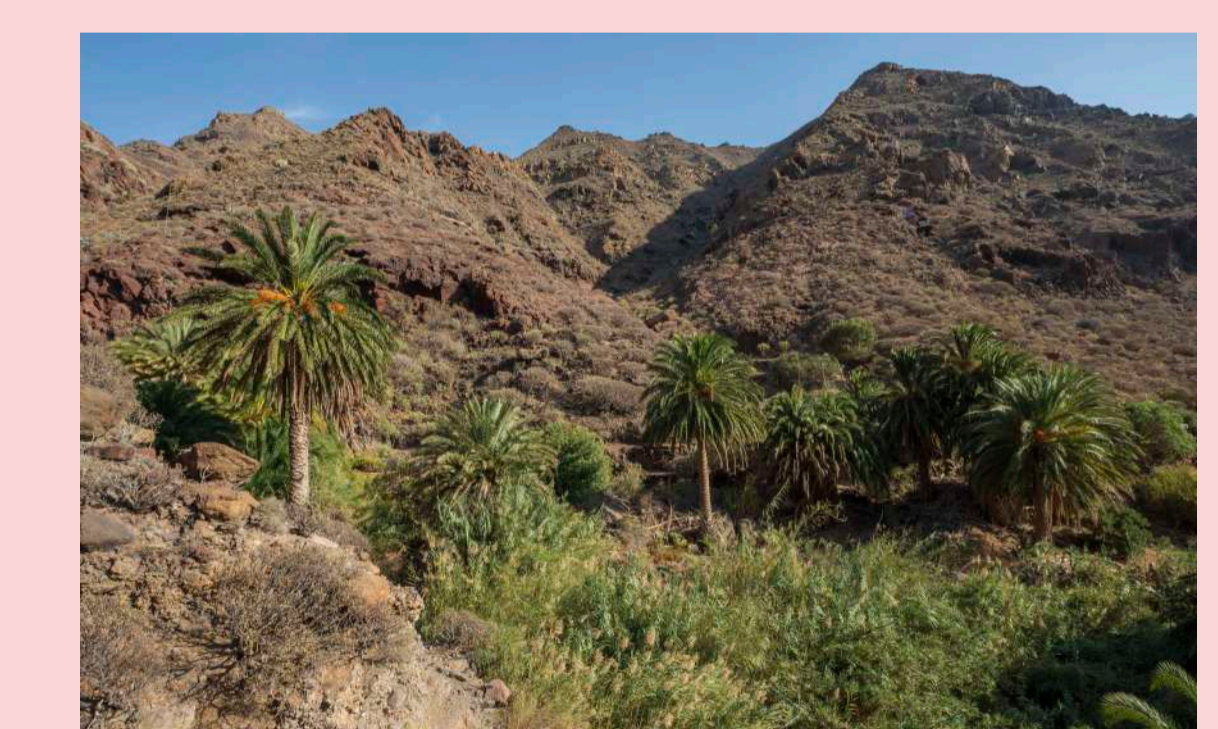
6 Especies invasoras Invasive species